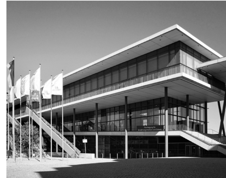
Internationales Congress Center Dresden